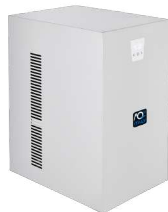
Erogatore L - XL