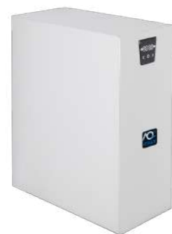
Erogatore S - M